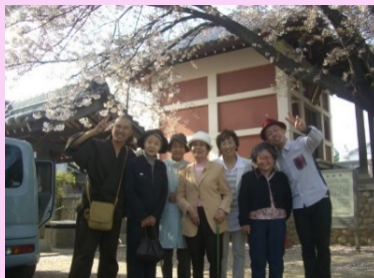
恒例となった、桜コンサートにて