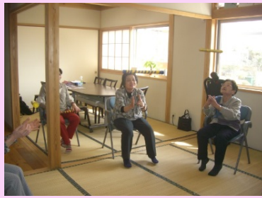
さあ、棒を投げてキャッチ！