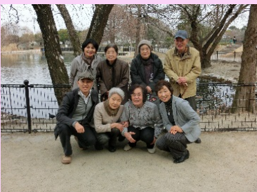
昆陽池に白鳥を見に行きました