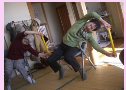
とても89歳とは思えません！