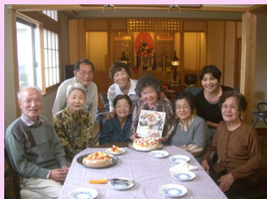
誕生日、おめでとうございます！