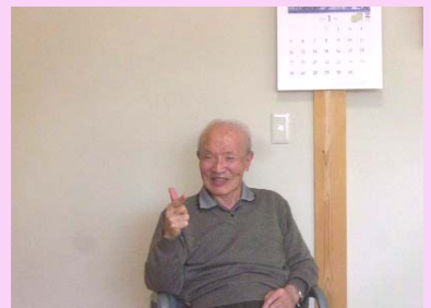
素敵な笑顔のTさん