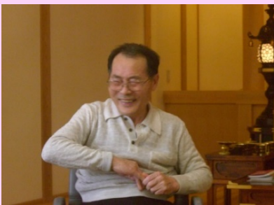
指先を刺激しています。